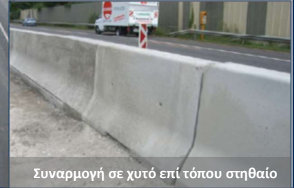
Συναρμογή σε χυτό επί τόπου στηθαίο