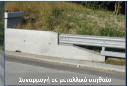
Συναρμογή σε μεταλλικό στηθαίο